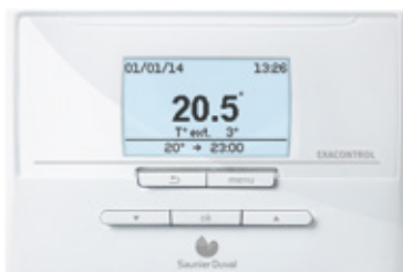
Exacontrol E 7C