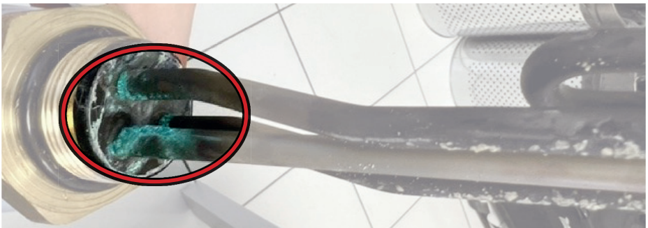
A tartály földelésének hiányában kialakuló korrózió